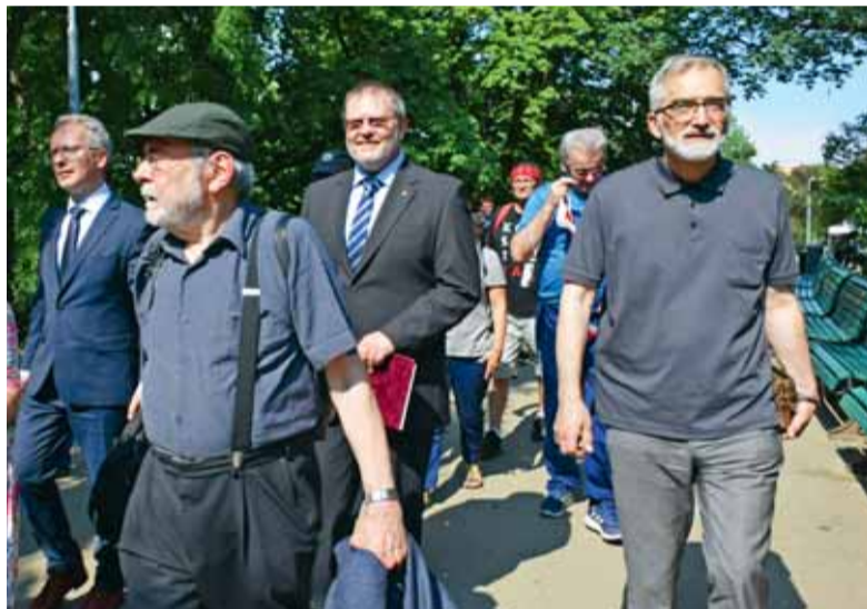
Při novém pojmenování promenády v Riegrových sadech

budeme moci tuto inženýrskou stavbu již zakrátko obdivovat jen jako artefakt, aniž by byl pro dopravu použitelný. Podle mne je ocelový a tento materiál má svou mez únavy. Když mnohokrát ohnete drát, tak vám praskne. Tady průřezky vlaků namáhají kovové prvky již téměř 120 let. Nebyly navrženy na dnešní zátěž, ani z oceli odpovídající dnešním požadavkům. Vlaky se přes most plouží skoro krokem a rychlost bude muset být zanedlouho ještě více omezena. Městská část se v dané věci shoduje s městem, že most je třeba co nejdříve nahradit novým tříkolejným, vzhledově podobným. Na Výtoni je třeba vybudovat zastávku s možností přestupu na tramvaj. Dlouhodobá výluka a rozebírání mostu, nahrazování podstatné části prvků novými by bylo polovičatým, komplikovaným a výsledně daleko dražším řešením. Stávající konstrukci nebo její část lze zachovat přesunutím na Císařskou louku či na Be-