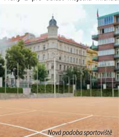
Nová podoba sportoviště

těm, ale nadřadili jsme bezpečnost dětí a kvalitu stavby,“ vysvětlil místostarosta Prahy 2 pro oblast majetku Michael