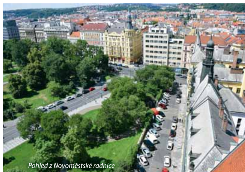
Pohled z Novoměstské radnice

Prohlídky při západu slunce jsou putováním v čase. Novoměstská radnice vznikla v době, kdy Karel IV. uskutečňoval své smělé vize rozkvětu Prahy. V Praze 2 se dochovaly i starší památky, ale Novoměstská radnice patří k nejrozsáhlejším, kde je stále co objevovat. kla