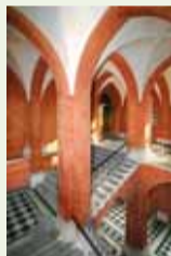
Porodnice U Apolináře, mecenáš byl Josef Hlávka